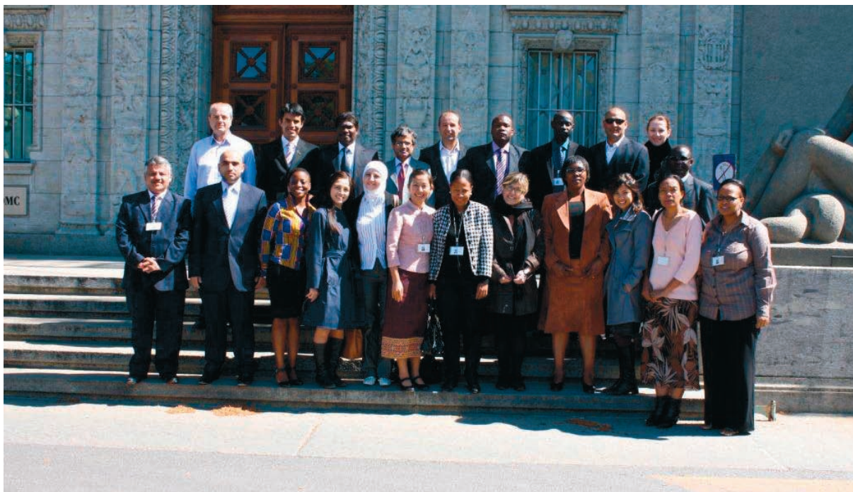
Los participantes en el Curso avanzado de política comercial

de avanzar hacia una Secretaría sin soporte de papel, se proporcionó a cada participante un ordenador portátil para su uso personal durante los tres meses del curso con el fin de darle acceso a un "aula virtual" en la que se puso a su disposición toda la documentación y que facilitó la realización de los proyectos individuales.