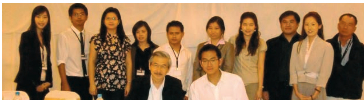
Participantes en el Curso regional avanzado sobre técnicas de simulación de negociaciones comerciales – China

tenían escasos conocimientos sobre el asunto, mientras que al finalizar la actividad, el 75 por ciento de ellos tenían considerables conocimientos sobre el particular. El 97 por ciento de los participantes estimaron que esta actividad de asistencia técnica había sido profesionalmente útil o pertinente.