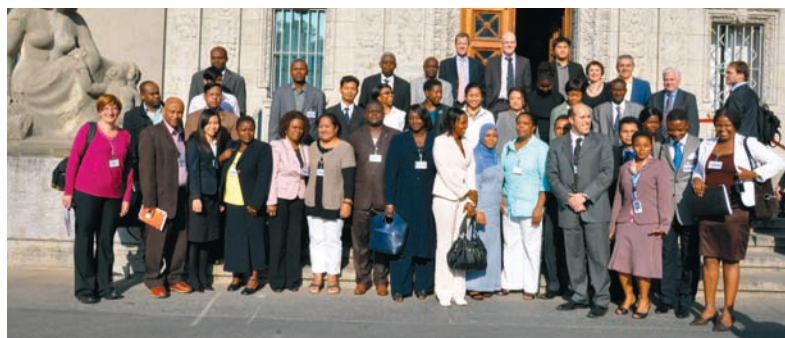
Los participantes en el Simposio

Los participantes regresaron a sus capitales habiendo adquirido enseñanzas y entusiasmo, con la misión de hacer de los centros de referencia las ventanas de la OMC al mundo.