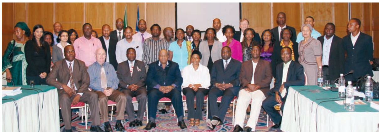
Los participantes en el Curso regional avanzado sobre técnicas de simulación de negociaciones comerciales – Namibia

conocimientos sobre el asunto, mientras que al finalizar la actividad, el 80 por ciento de ellos tenían considerables conocimientos sobre el particular. Todos los participantes consideraron que esta actividad de asistencia técnica les había sido útil profesionalmente o pertinente.