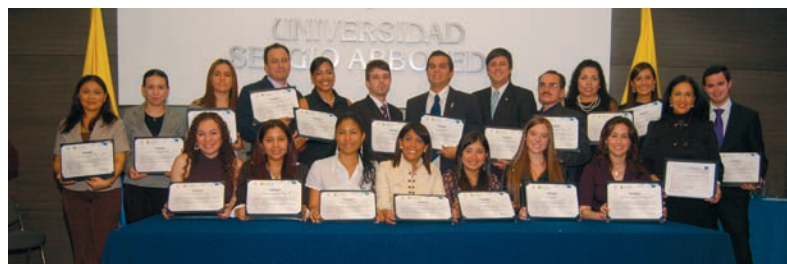
Participantes en el Curso Regional de Política Comercial para América Latina con su diploma

El Curso Regional Avanzado sobre Técnicas de Simulación de Negociaciones Comerciales para América Latina, organizado y realizado en asociación con la Universidad Sergio Arboleda en Bogotá (Colombia) finalizó el 15 de abril. Conjuntamente, la OMC y la institución asociada concedieron un diploma a 20 orgullosos participantes. Esta actividad de capacitación, que se había iniciado el 29 de enero, fue la tercera que se organizaba en Bogotá. Todos los participantes consideraron