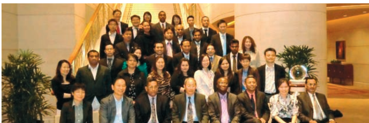
Los participantes en el Curso regional avanzado sobre técnicas de simulación de negociaciones comerciales – Tailandia

tenían escasos conocimientos sobre el asunto, pero después de la actividad, el 88 por ciento de ellos tenían considerables conocimientos sobre el particular. El 94 por ciento de los participantes consideraron que esta actividad de asistencia técnica les había sido profesionalmente útil o pertinente.