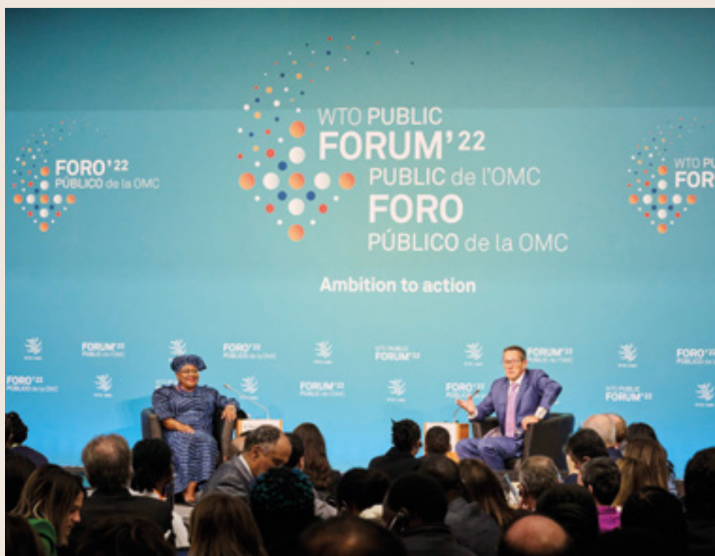
La DG Okonjo-Iweala échange avec le présentateur de CNN Richard Quest au Forum public 2022.

Les participants ont reconnu que les organisations internationales, les gouvernements, les entreprises et la société civile devaient travailler en coordination pour mettre à jour les règles de l'OMC, qui avaient été rédigées il y a plus d'un quart de siècle à une époque où la crise environnementale était bien moins aiguë.