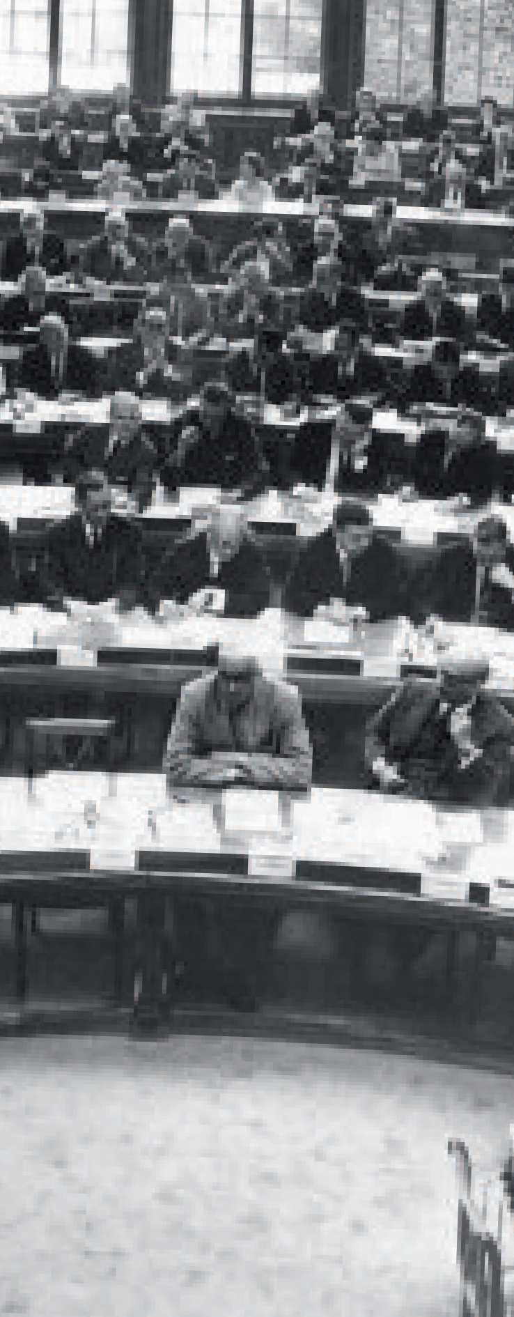
◀ La septième session de la Commission des industries textiles du B.I.T., en 1966.