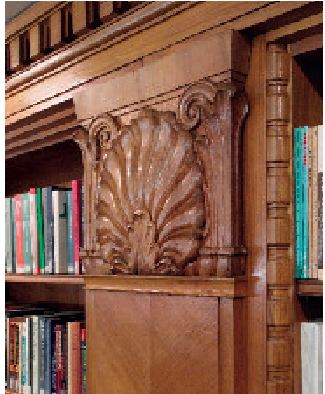
Étagères de la Bibliothèque ► sculptées en merisier.