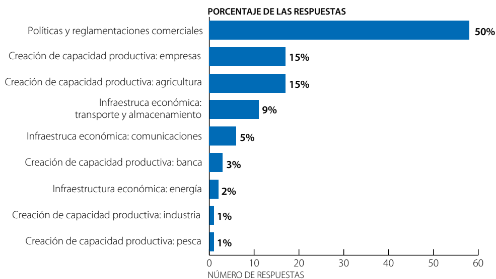
Gráfico 0.2 Relatos de experiencias concretas, por sectores

Fuente: Ejercicio conjunto OCDE/OMC de vigilancia de la Ayuda para el Comercio (2015).